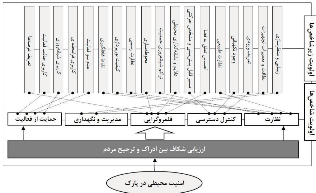
تصویر ۵. مدل نهایی پژوهش بر اساس بررسی شکاف میان ادراک و ترجیح استفاده‌کنندگان