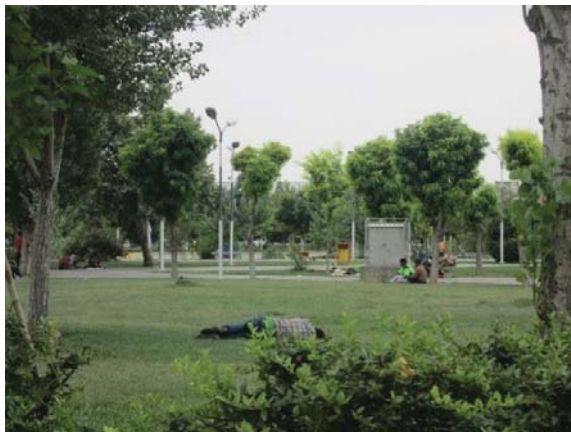
تصویر ۴. نمایی از بوستان هنردی