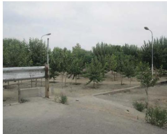
تصویر ۳. نمایی از بوستان شهید حقانی

استفاده از پرسش‌نامه محقق ساخته بر اساس طیف لیکرت ۱۶ ۵ گزینه‌ای، ادراک و ترجیح ساکنان از مؤلفه امنیت سنجیده می‌شود. تجزیه و تحلیل داده‌ها در چند مرحله انجام می‌گیرد.