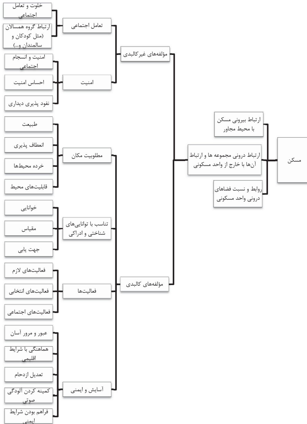
شکل ۱. کدینگ‌های اطلاعاتی بدست آمده از فضای باز مسکن (مأخذ: نگارنده)