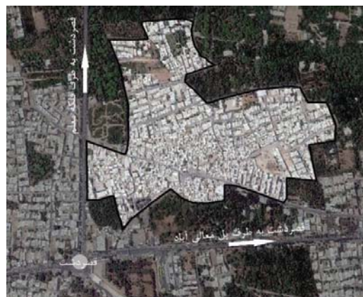
شکل ۱. محدوده مورد مطالعه.

از ۲۶ گویه پرسش‌نامه، ۲۵ گویه به صورت پنج گزینه‌ای (طیف لیکرت) مطرح شده که ۱۷ گویه آن با جواب‌های خیلی زیاد، زیاد، متوسط، کم و خیلی کم همراه بوده و ۸ سؤال با توجه به شناسایی عناصر محله و ادبیات موضوع در همان طیف کیرت با مطرح کردن موارد مورد نظر پژوهش