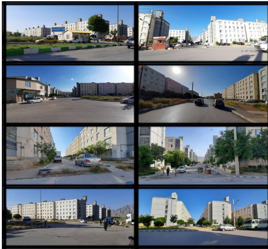
Fig. 2 Pictures of the current situation of the Dolat-e-Mehr residential complex