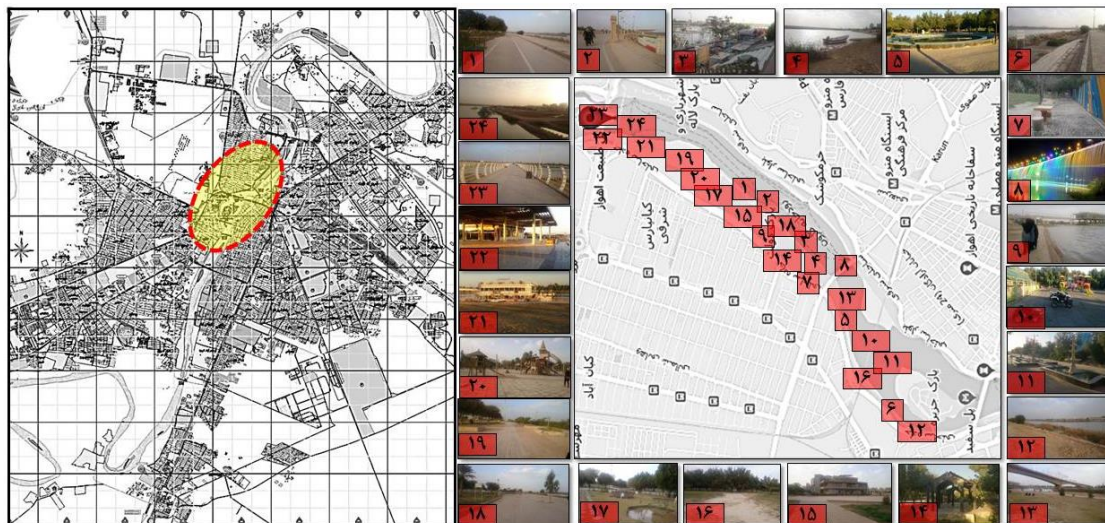
Fig. 2 Map of Ahvaz and study area

اهواز یکی از شهرهای ایران است و به عنوان مرکز استان خوزستان شناخته شده است. یکی از مهم‌ترین پتانسیل‌های گردشگری- تفریحی شهر رودخانه کارون است. با توجه به کشیدگی شمال به جنوب و فاصله‌ای که به واسطه عرض زیاد خود داشته است شهر را به دو حوزه شرقی - غربی تقسیم کرده است. کارون به عنوان لبه‌ای قوی معرف اصلی شهر اهواز است اما با نادیده گرفتن پتانسیل کارون، جانمایی فعالیت‌های خاص در کنار آن تا حدودی بی‌ارتباط با یکدیگر، به شکل محدودیت درآمده و تنها اکتفا به پل‌های عبوری برای اتصال پهنه شرق و غرب رودخانه صورت گرفته است. این در حالی است که با توجه به نیاز شهر به فضاهای عمومی با استفاده از زمین‌های بایر و قابل بهره‌برداری در مجاورت کارون و به عبارتی استفاده از فرصت‌های ساحلی این رودخانه به طول