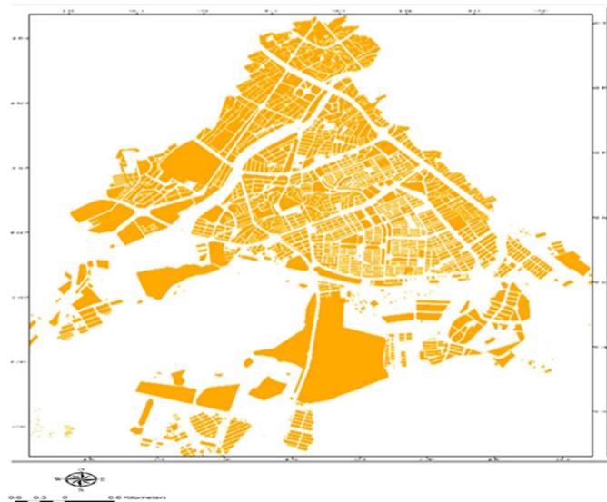
Fig. 1 Location of villa houses in district 2 of Ardabil city