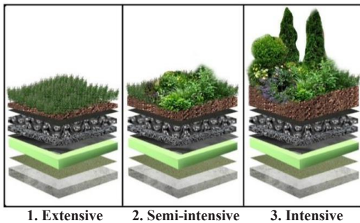
Fig.1. Types of green roofs

افزایش تقاضا برای سقف‌های سازگار با محیط زیست که به عنوان سقف‌های سبز یا سقف‌هایی که با پوشش گیاهی پوشانده شده است شناخته می‌شوند، بدین معنی است که بام سبز در جهان به ویژه در مناطق متراکم شهری، بسیار مورد توجه قرار گرفته است (Tabatabaee et al., 2019). با مروری کلی بر ادبیات بام سبز، طیف وسیعی از مزایای زیست محیطی، اقتصادی و اجتماعی دریافت می‌شود (Francis & Jensen, 2017). همانطور که در شکل ۱ نشان داده شده است، بام سبز به سه نوع است: گسترده (بستر سبک، بدون آبیاری، ضخامت بستر ۱۵-۴ سانتی‌متر، به طور عمده گیاهان مکمل)؛ نیمه فشرده (بستر سبک، آبیاری، ضخامت بستر ۳۰-۱۲ سانتی‌متر، گیاهان یا بوته‌های کم توسعه) و فشرده (خاک طبیعی، آبیاری، ضخامت زیر ۳۰ سانتی‌متر، انتخاب نامحدود گیاهان (Lata et al., 2018).