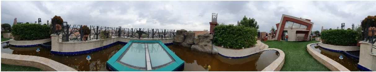
Fig.2. The image of the green roof used in virtual reality (VR) technology

روی چشمان خود قرار داده و تصاویر بام سبز را همراه با گوش دادن به اصوات محیط مشاهده کردند و به صورت مجازی در محیط قرار گرفتند. بدین صورت که با هر حرکت فیزیکی و تغییر جهت شرکت کننده، زاویه دید او نیز تغییر می‌یافت (شکل ۲).