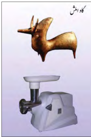
شکل ۶: چرخ گوشت توکا - شرکت جهان آوا