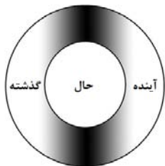
شکل ۲. تاریخ در نگاه سنتی

زمان تاریخی عرصه‌ای است که در آن همه فعالیت‌ها و تجارب بشری ساماندهی می‌شود. در جوامع غربی، زمان به‌عنوان ساختاری خطی که در آن زنجیره‌ای از رخدادها که از نقطه ثابتی در گذشته شروع می‌شوند و به جلو پیش می‌روند درک می‌شود (عظیمی نصرآباد، ۱۳۸۳: ۲۵ و ۲۶)؛ رویدادها از رهگذر لحظه حال به سوی هدفی در آینده پیش می‌رود (شکل ۱). در مقابل، جوامع سنتی درکی دوری (چرخشی) از زمان دارند؛ چرخه‌ای پیوسته و لایتناهی از تکرار طبیعت (رضوی، ۱۳۸۵: ۸۶) و رفتارهای بشر (رضوی، ۱۳۹۱: ۴۰-۴۷) (شکل ۲).